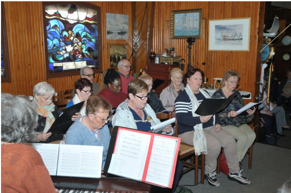
Het koor uit Brustem- Aalst bij Sint-Truiden waar ik destijds ook bezig was