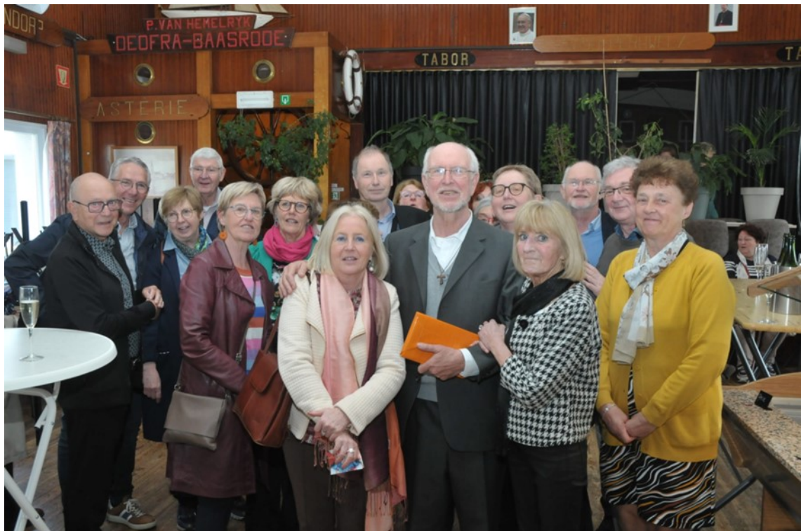
Met enkele familieleden