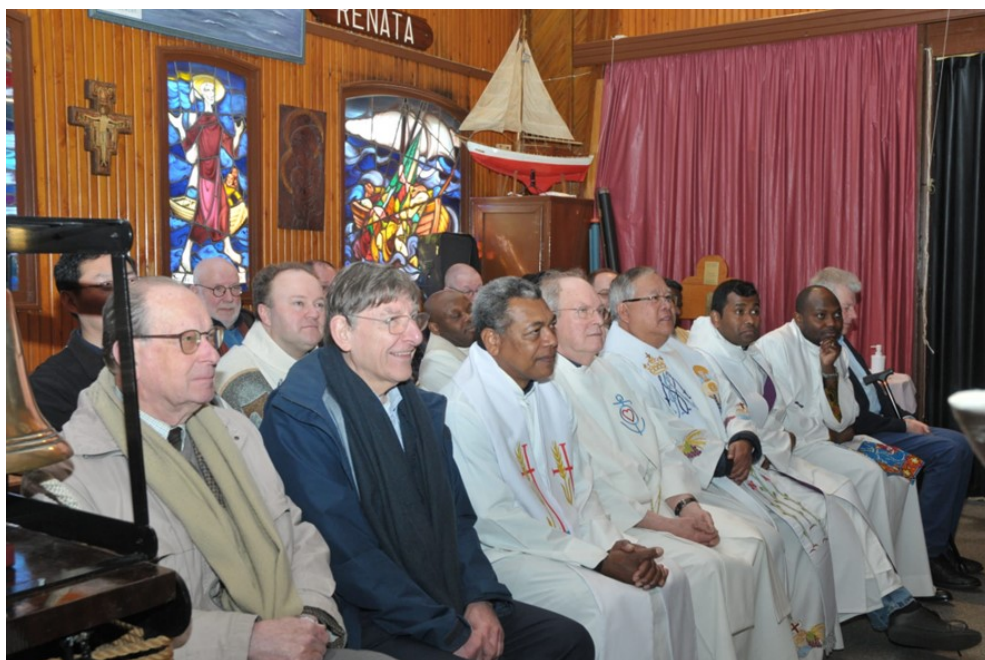
Met 31 priesters en religieuzen vooraan, en in de kerk...