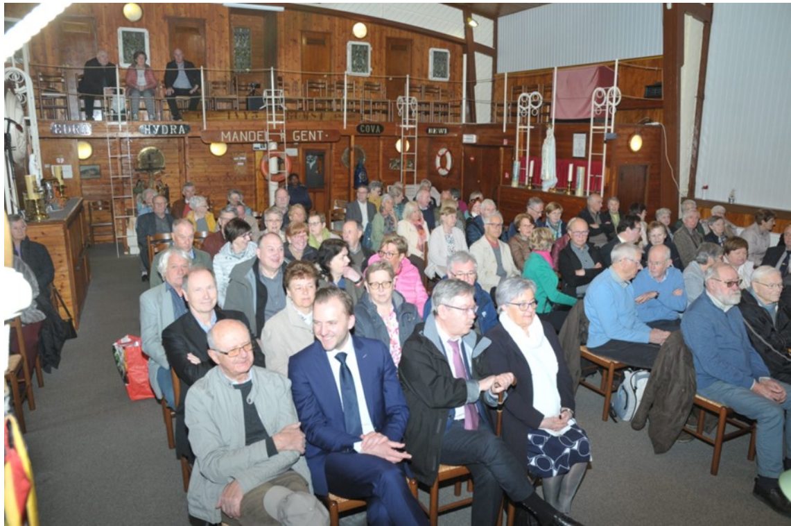
Met 160 sympathieke vrienden van overal