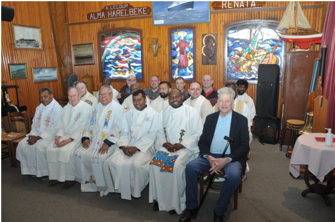
Met 31 priesters en religieuzen vooraan, en in de kerk...